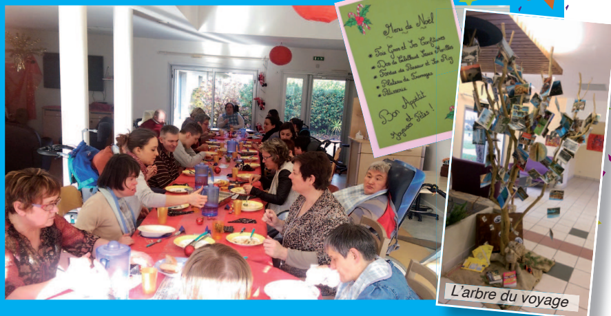
L'arbre du voyage

Le jeudi 13 décembre l'ensemble des résidents ainsi que les équipes du FAM Ker Sioul ont pu savourer, ensemble, un délicieux repas de Noël préparé par la Cuisine Centrale de l'Association sur la thématique du voyage.